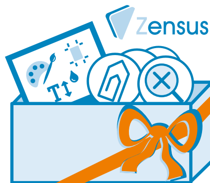
Zensus 6 erscheint mit vielen Neuerungen.

In diesem Versionssprung unserer Evaluationslösung haben wir zahlreiche Neuerungen und Verbesserungen eingebaut. Die wohl einschneidendste Veränderung hat mit den verschiedenen Auswertungsformen zu tun, die Sie mit Zensus erstellen können: Diese wurden